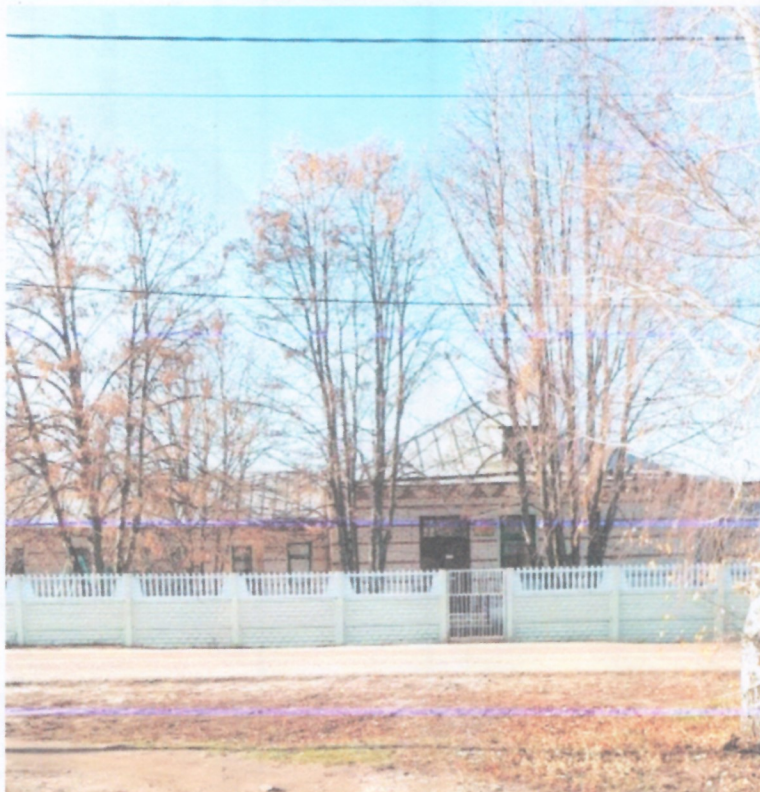
Подход с южной стороны