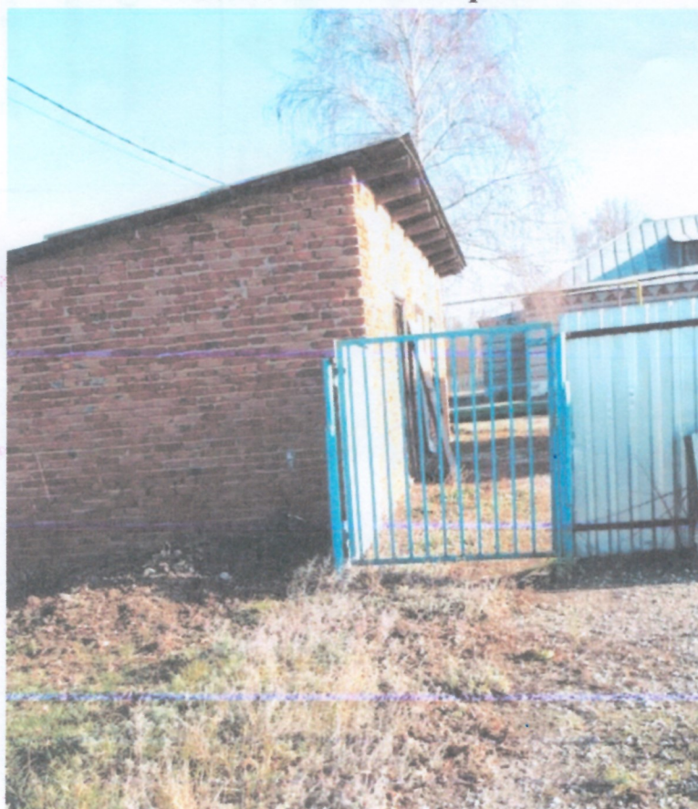
Подход с северной стороны