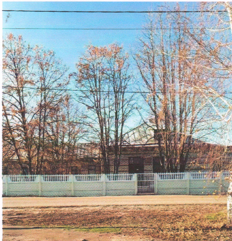
Подход с южной стороны