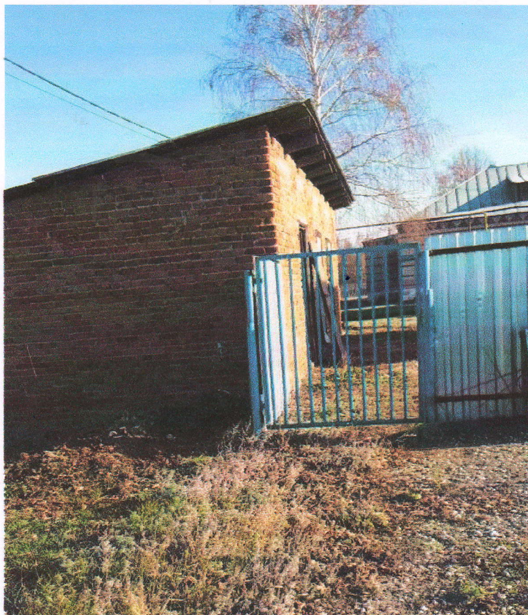
Подход с северной стороны